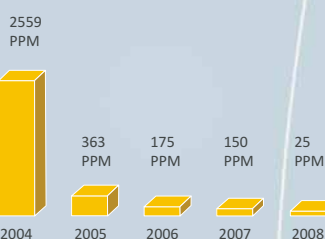
DYNAMIKA POPRAWY JAKOŚCI BKT ELEKTRONIK 2004 - 2008

Skuteczność Systemu Zarządzania Jakością i Środowiskiem oceniana jest na podstawie bieżącego monitoringu wyznaczonych wskaźników dla założonych celów, poprzez wewnętrzne i zewnętrzne audyty oraz okresowe przeglądy systemu.